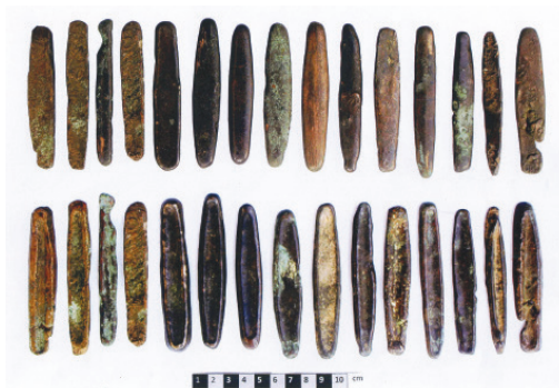
Tiền Lào ở Điện Biên

Sở dĩ ở Điện Biên (Việt Nam) phát hiện ra tiền LAT là ở Điện Biên có một số bản của người Lào di cư sang ở và mang theo nhiều tiền này tiêu dùng trong nội bộ. Sau một thời gian dài, người Lào đã Việt hóa thì Tiền LAT cũng chấm dứt vai trò của nó.