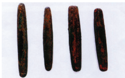
Tiền ở Savannakhet

Người Lào gọi tiền này là LAT. Về hình dáng, tiền LAT có hình thuyền, giữa phình to và thon nhỏ lại ở hai đầu. Tiền có 2 loại: một loại để trơn, một loại có 4 hàng hoa văn hình tròn chạy dọc thân. Về chất liệu có loại bằng đồng, có loại bằng bạc.