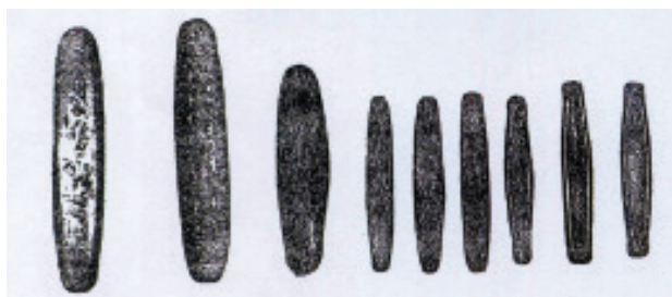
Tiền LAT ở các địa điểm của Lào