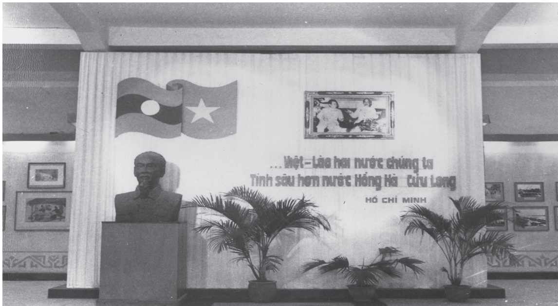
Hình 7. Trưng bày chuyên đề “15 năm nước CHDCND Lào” tháng 11/1990 tại Bảo tàng Cách mạng Việt Nam (nay là BTL SQG)

- Phối hợp tổ chức các trưng bày chuyên đề: Kỷ niệm 100 năm ngày sinh Chủ tịch Hồ Chí Minh , tháng 5/1990 tại Bảo tàng Quốc gia Lào; Trưng bày chuyên đề “ 15 năm nước CHDCND Lào ”, tháng 11/1990 tại Bảo tàng Lịch sử Quốc gia; Trưng bày lưu động “ Đảng Cộng sản Việt Nam - Đại hội và thành quả ” tại Bảo tàng Quốc gia Lào, năm 1997.