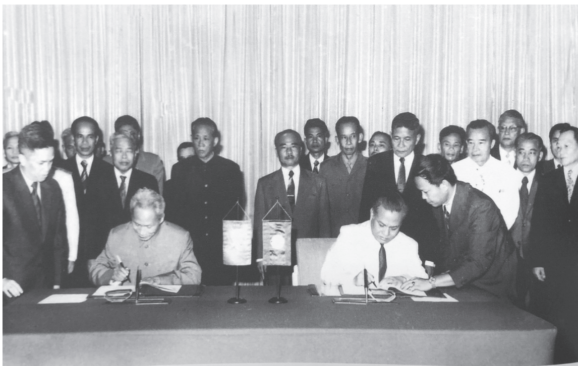
Hình 2. Thủ tướng Phạm Văn Đồng và Thủ tướng Kaysone Phomvihane ký Hiệp ước Hữu nghị và Hợp tác giữa hai nước Việt Nam - Lào tại Viêng Chăn ngày 18-7-1977