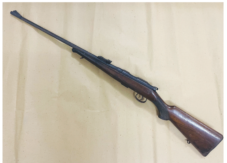
Hình 6. Súng trường của đồng chí Khamtai Siphandon tặng Thiếu tướng Huỳnh Đắc Hương năm 1972

+ Hộ chiếu ngoại giao do Bộ ngoại giao Việt Nam cấp cho ông Vũ Chân (Đại tướng Chu Huy Mân) sang công tác tại Lào.