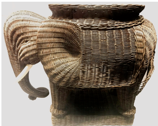
Hình 5. Voi tết bằng dây guột, Đảng NDCM Lào tặng Đại hội Đảng Cộng sản Việt Nam lần thứ V, năm 1982

+ Mảnh xác máy bay F4C , tiểu đoàn 456 pháo cao xạ Lào tặng đoàn đại biểu Chính phủ cách mạng lâm thời Cộng hòa miền Nam Việt Nam, ngày 20/10/1969.