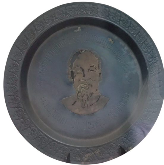
Hình 3. Đĩa bạc khắc chân dung Chủ tịch Hồ Chí Minh, đoàn Đại biểu Đảng Nhân dân cách mạng Lào tặng Đại hội lần thứ V Đảng Cộng sản Việt Nam năm 1982

+ Đĩa bạc khắc chân dung Chủ tịch Hồ Chí Minh , đoàn Đại biểu Đảng Nhân dân cách mạng Lào tặng Đại hội lần thứ V Đảng Cộng sản Việt Nam năm 1982. Quanh lòng đĩa có khắc hai dòng chữ tiếng Lào: dòng phía trên có nghĩa là Đại hội lần thứ V Đảng Cộng sản Việt Nam ; dòng phía dưới có nghĩa là Đoàn đại biểu Đảng Nhân dân cách mạng Lào .