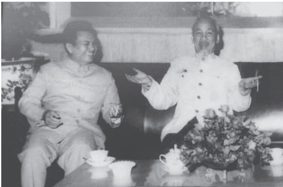
Hình 1. Chủ tịch Hồ Chí Minh và Chủ tịch Kaysone Phomvihane năm 1961 tại Hà Nội